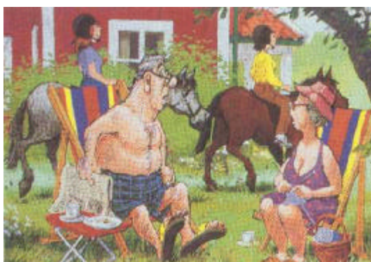
"Hallå där! Vet ni inte att det är förbjudet att rida på annans tomt!"

Av regeringsformen framgår att alla ska ha tillgång till naturen enligt allemansrätten. Men den som rör sig i skog och mark är också skyldig att ta hänsyn till sin omgivning. Det gäller såväl till växt och djurliv som till människor, till exempel till andra som ägnar sig åt friluftsliv. Miljöbalken föreskriver att ”var och en som utnyttjar allemansrätten eller annars vistas i naturen skall visa hänsyn och varsamhet i sitt umgänge med den” (7 kap. 1 §). Allemansrätten medför på så sätt inte bara rättigheter utan också skyldigheter.