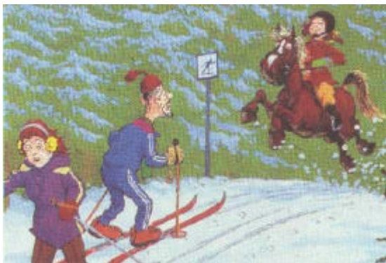
Skidspår är inte ridspår! Titta på skylten hur spåret är markerat.

Rid/kör inte på vandringsleder, i motionsspår eller i markerade skidspår. Undvik att rida/köra även i andra uppåkta skidspår. Vandringsleder brukar markeras med orange band runt träd och stolpar. Motionsspår och skidspår har blåa, röda, gula eller gröna märken på träd eller stolpar. Men ibland kan spåren markeras på annat sätt. Ta reda på vad markeringarna betyder i det område du brukar rida/köra i. Vid ridning/körning får du inte använda gång- eller cykelbanor.