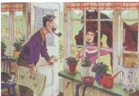
"God dag, farbror. Får jag rida på farbrors äng?" Fråga om lov om du tänker rida ofta inom samma område.

Att ha häst som hobby eller yrke är populärt och vi hästmänniskor är många. Detta medför ett naturligt slitage på naturen. Därför måste vi som sysslar med hästsporter visa stor försiktighet, gott omdöme och hjälpas åt att upprätthålla det fina samarbete vi har med bland andra markägare och naturvänner. Annars finns risken att den unika friheten som allemansrätten ger oss kan komma att inskränkas.